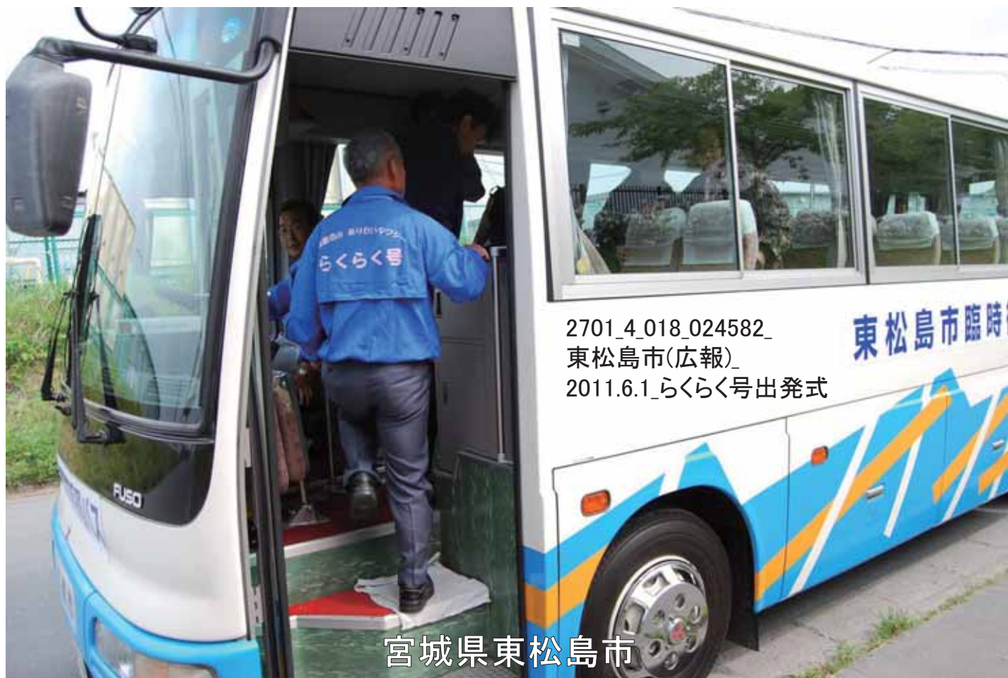
2701_4_018_024583_東松島市(広報)_2011.6.1_らくらく号出発式_東松島市役所