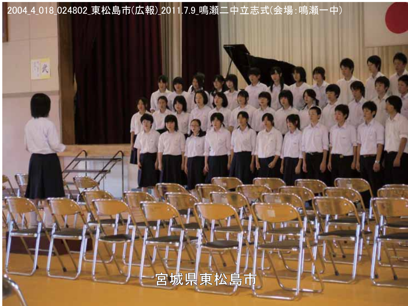
2004_4_018_024802_東松島市(広報)_2011.7.9_鳴瀬二中立志式(会場:鳴瀬一中)