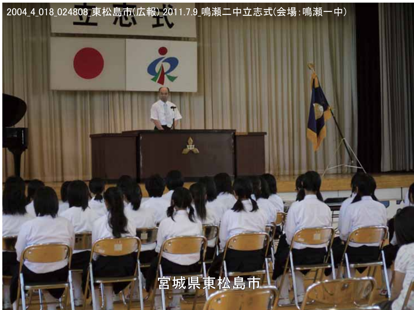
2004_4_018_024808_東松島市(広報)_2011.7.9_鳴瀬二中立志式(会場:鳴瀬一中)