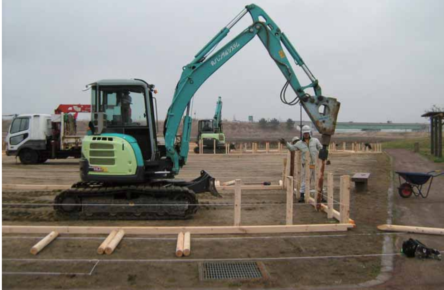
0836_3_035_043737_ 赤井市民センター_ 2011.4.22_ 仮設住宅設置