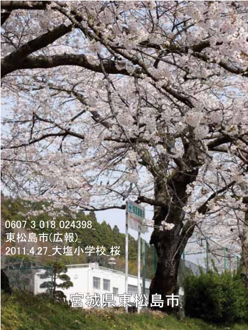
0607_3_018_024398_ 東松島市(広報)_ 2011.4.27_大塩小学校_桜